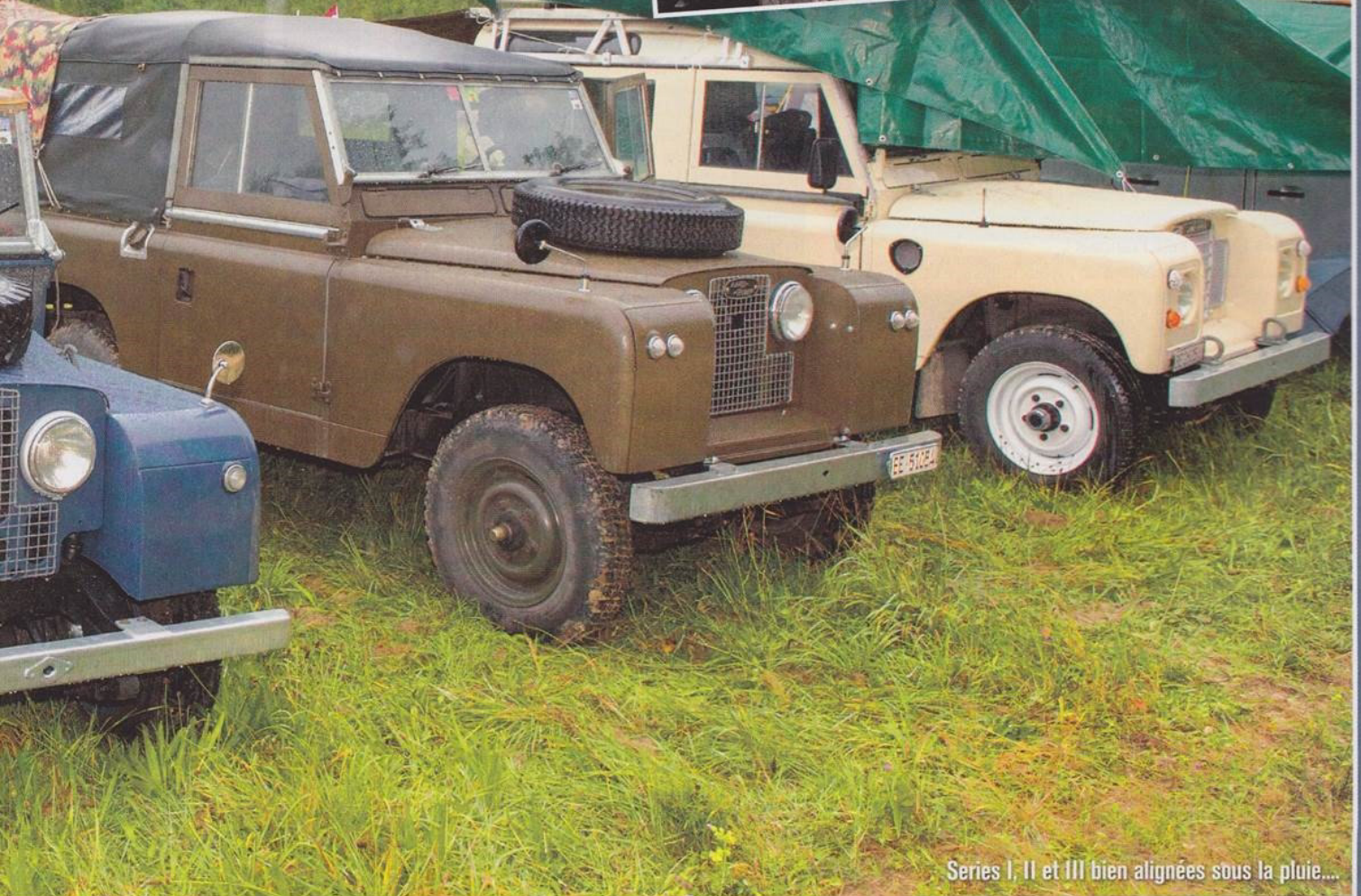
Series I, II et III bien alignées sous la pluie....