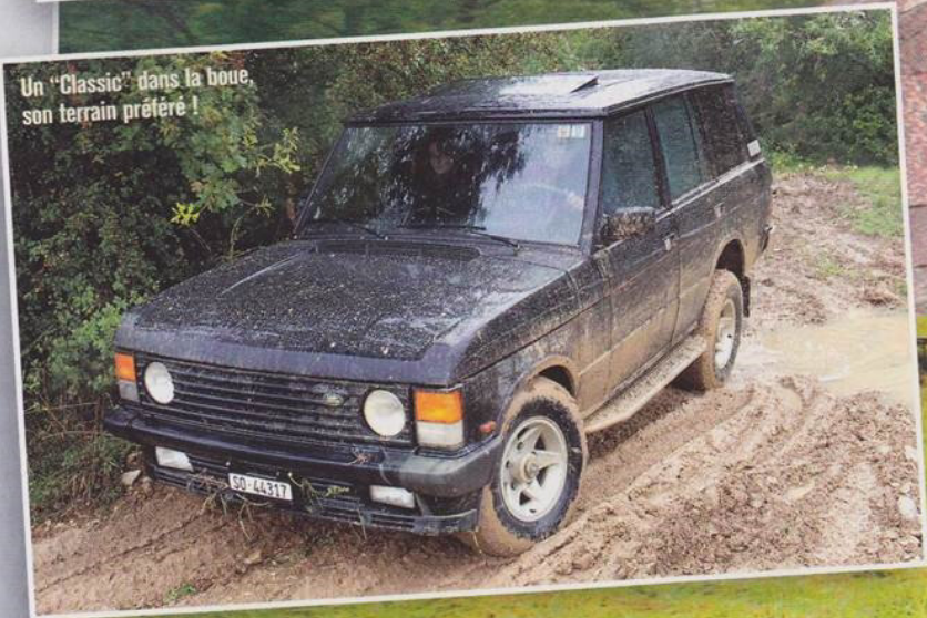
Un "Classic" dans la boue, son terrain préféré !