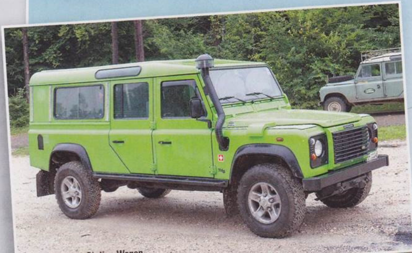
Magnifique 130 Station Wagon.

4° Land Rovers of Switzerland à Bure (CH) 1 er et 2 septembre