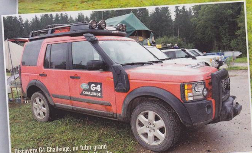
Discovery G4 Challenge, un futur grand "collector". Ici celui de Pierre de Neuville.